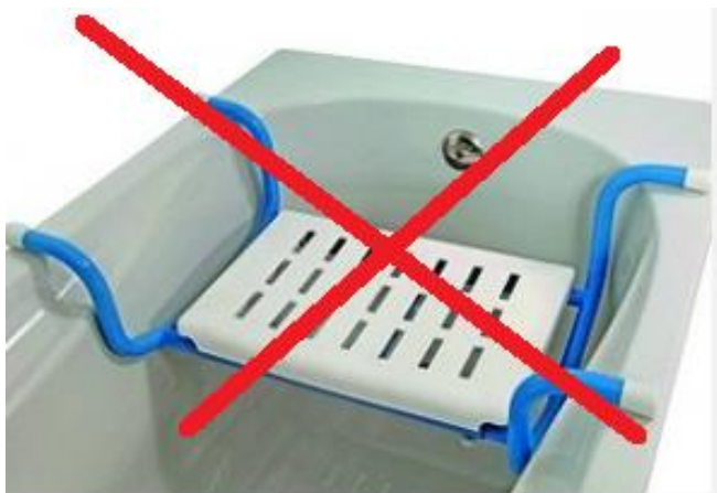
Siège de bain suspendu non fonctionnel