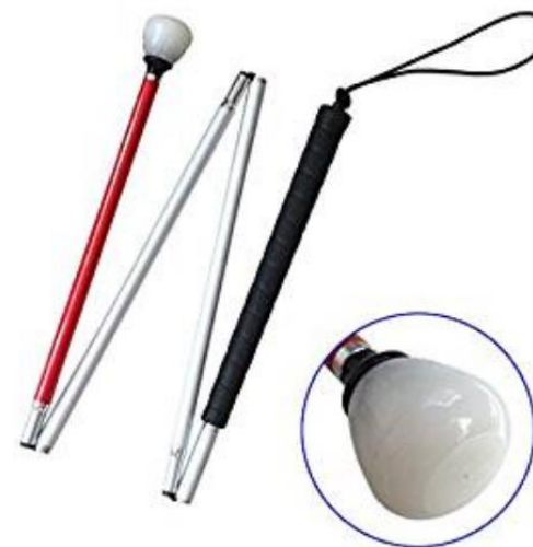
Canne tactile pour personne aveugle ou malvoyante