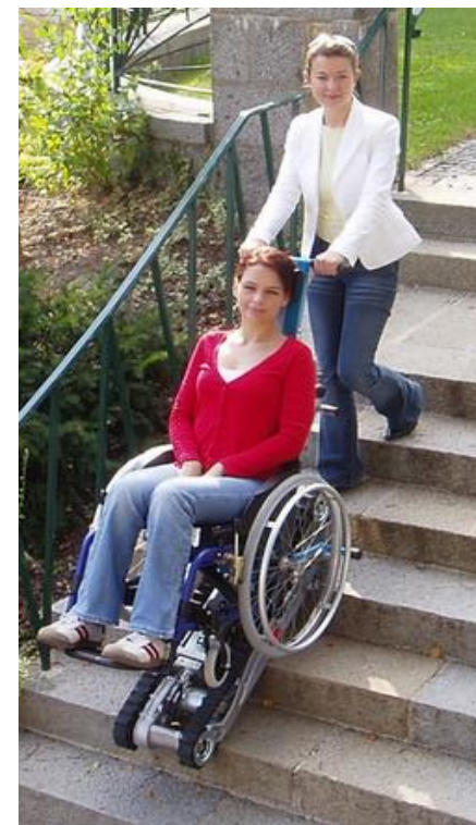
Franchisseur d'escaliers à chenilles