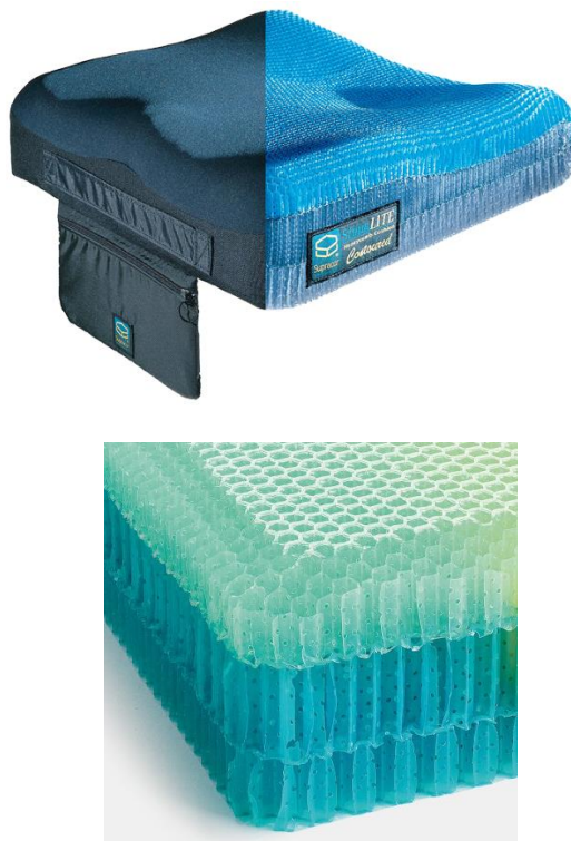
Coussin anti-escarres en fibres creuses