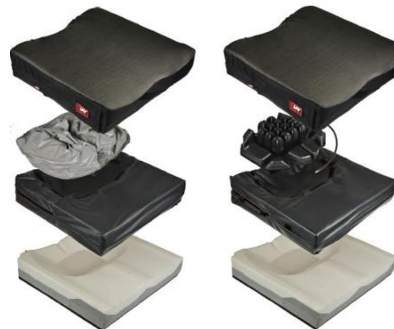
Coussin anti-escarres mixte avec insert gel ou air