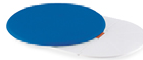
Disque de transfert tournant et glissant pour siège de bain électrique