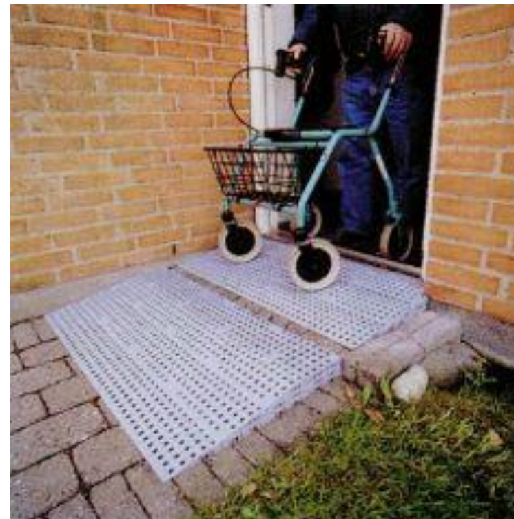
Rampe de type « Lego »