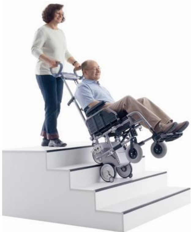
Franchisseur d'escaliers à roues