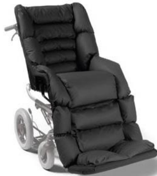
Assise avec granulats de latex