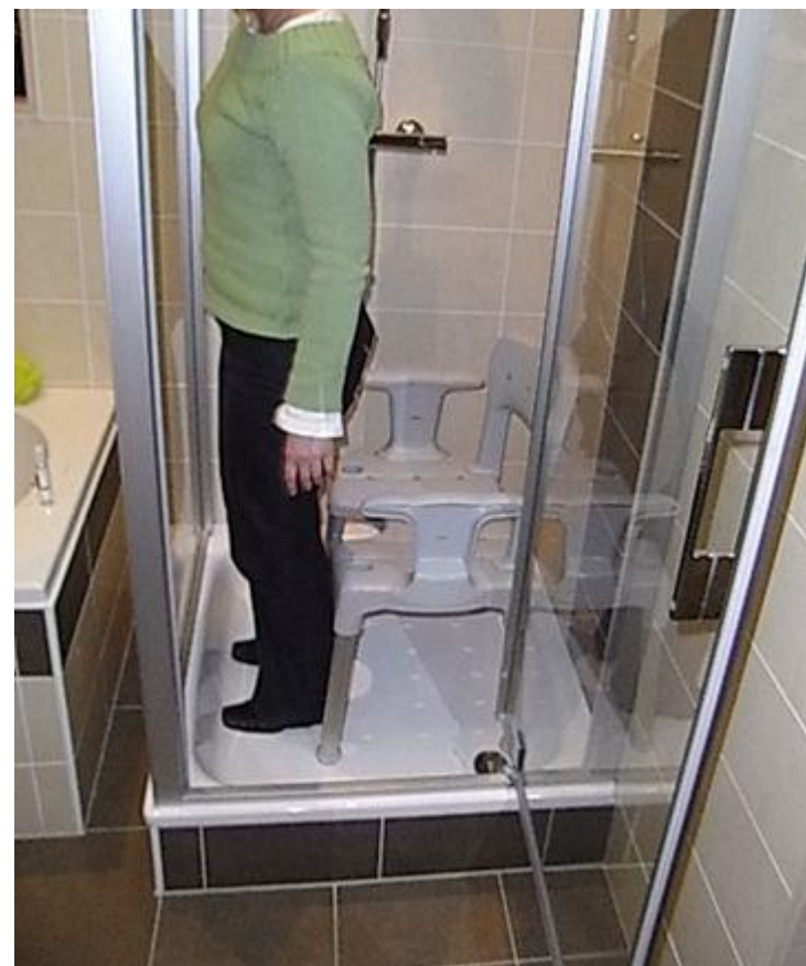
Bac : ext 90 x 90 cm / int 70 x 70 cm