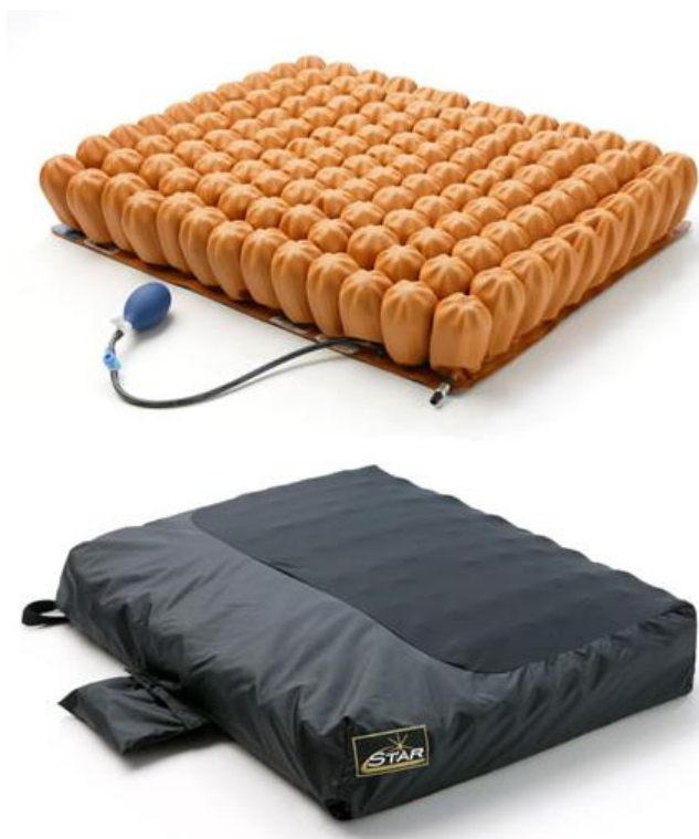
Coussins anti-escarres pneumatiques