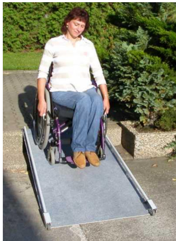
Rampe Alu Mobile